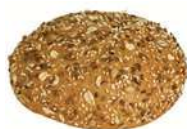
PANINI SOLROS 8 st x 120 g Artnr: 1250 Påspackat 4-pack Artnr: 250