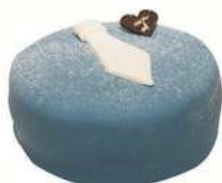
FARS DAG TÅRTA 8 bitar Artnr: 2761