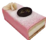
MORSDAG STUBBE 4 bitar Artnr: 2809