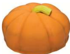
HALLOWEENTÅRTA 8 bitar Artnr: 2756