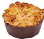
★ TOSCAKRONA 5 st x 65 g / frp Artnr: 609 2-pack Artnr: 6099