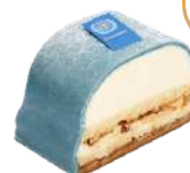
FN BLÅ PRINSESS BAKELSE 2-pack Artnr: 2709