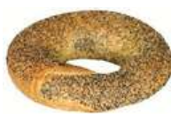
GIFFEL VALLMO 8 st x 120 g Artnr: 1226