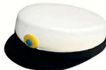
STUDENTTÅRTA 8 bitar Artnr: 2996 10 bitar Artnr: 2997 12 bitar Artnr: 2998 16 bitar Artnr: 2999