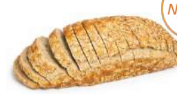
BAGARENS LIMPA SKIVAT 1 st x 500 g Artnr: 315