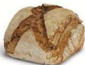
FULLKORNSBRÖD 1 st x 500 g Artnr: 1306 Påspackat Artnr: 2304