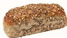
FRÖBRÖD 1 st x 500 g Artnr: 2319 Påspackat Artnr:1319