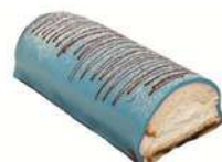
FARS DAG STUBBE 4 bitar Artnr: 2808