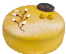
PÅSKTÅRTA 8 bitar Artnr: 2970