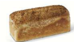
FORMBRÖD LINFRÖ 1 st x 500 g Artnr: 2302 Påspackat Artnr:1320