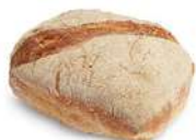
LEVITO 15 st x 80 g Artnr: 1109 Påspackat 8-pack Artnr: 109 Påspackat 5-pack Artnr: 1099