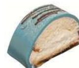
FARS DAG BAKELSE 2-pack Artnr: 2707