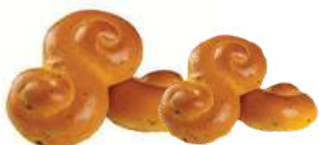
LUSSEKATT LYX 1 st x 75 g Artnr: 413 1 st x 45 g Artnr: 420