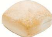
KÄLLARFRANSKA 15 st x 80 g Artnr: 1105 Påspackat 8-pack Artnr: 105 Påspackat 5-pack Artnr: 1055