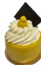
PÅSK BAKELSE LYX 2-pack Artnr: 2714