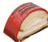
JULPRINSESS BAKELSE 2-pack Artnr: 2765