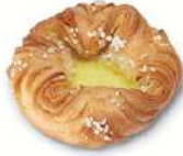
SPANDAUER 1 st x 80 g Artnr: 460