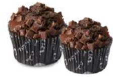
★ CHOKLADMUFFINS Små 12 st x 100 g /krt Artnr: 5055 Stor 24 st x 140 g /krt Artnr: 5505