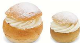
SEMLOR LAKTOSFRI 2 st x 125 g Artnr: 2420 SEMLA MINI LAKTOSFRI 2 st x 60 g Artnr: 425