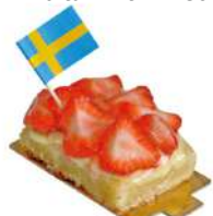
SVERIGE BAKELSE 2-pack Artnr: 2768