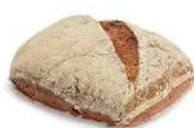
LEVITO NERO 15 st x 80 g Artnr: 1202 Påspackat 8-pack Artnr: 202