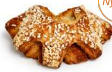
WIENERKAM 1 st x 80 g Artnr: 461