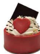
VALENTINE BAKELSE LYX 2-pack Artnr: 2757