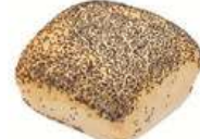
VALLMOFRANSKA 15 st x 80 g Artnr: 1103 Påspackat 8-pack Artnr: 106