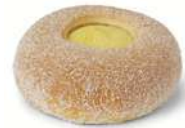
SOLBULLE 1 st x 100 g Artnr: 404