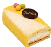
PÅSKSTUBBE 4 bitar Artnr: 2805