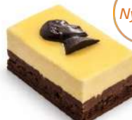
GUSTAV ADOLF BAKELSE 2-pack Artnr: 2760