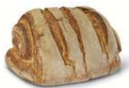
BONDBRÖD 1 st x 500 g Artnr: 2303 Påspackat Artnr: 1339