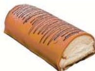
HALLOWEENSTUBBE 4 bitar Artnr: 2806