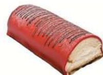
JULSTUBBE 4 bitar Artnr: 2807