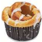
DANSKA WIENERBRÖD 1 st x 100 g Artnr: 462