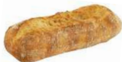
LEVAIN RUSTIK 10 st x 120 g Artnr: 1260