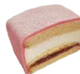
MORSDAG BAKELSE 2-pack Artnr: 2706