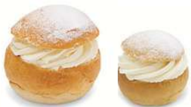
SEMLOR 2 st x 125 g Artnr: 2418 SEMLA MINI 2 st x 60 g Artnr: 423