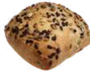
LEVITO FRÖ 15 st x 80 g Artnr: 1110

Våra frallor finns som påspackade både i 8-och 5-pack