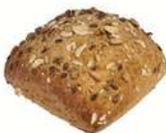
FRÖFRISKIS 15 st x 80 g Artnr: 1108 Påspackat 8-pack Artnr: 108 Påspackat 5-pack Artnr: 1088