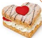
VALENTIN HJÄRTBAKELSE 2-pack Artnr: 2754