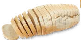
GREKISKT LANTBRÖD SKIVAT 1 st x 500 g Artnr: 313