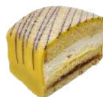
PÅSK BAKELSE 2-pack Artnr: 2708