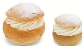
SEMLOR VANILJ LAKTOSFRI 2 st x 125 g Artnr: 2422 SEMLA MINI VANILJ LAKTOSFRI 2 st x 60 g Artnr: 422