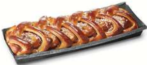
KANELLÄNGD 1 st x 450 g Artnr: 480