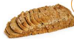
RÅGLIMPA SKIVAT 1 st x 500 g Artnr: 316