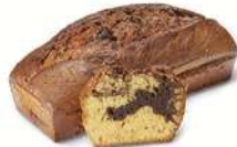
★ TIGERKAKA SMÅ 1 st x 500 g Artnr: 2546

Nu finns våra populära sockerkakor som 500 g