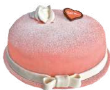
MORSDAG TÅRTA 8 bitar Artnr: 2766