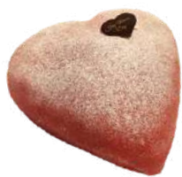
VALENTINTÅRTA 8 bitar Artnr: 2759