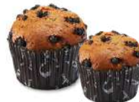
★ BLÅBÄRSMUFFINS Små 12 st x 100 g /krt Artnr: 5022 Stor 24 st x 140 g /krt Artnr: 5502