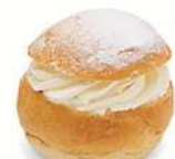
SEMLOR VEGANSK 2 st x 125 g Artnr: 2423