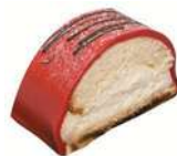
VALENTINE BAKELSE 2-pack Artnr: 2758