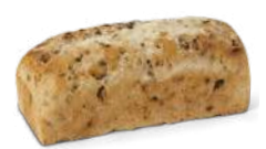
FRUKTBRÖD 1 st x 550 g Artnr: 2325 Påspackat Artnr:1322