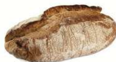
GRANN RUSTIK 1 st x 1100 g Artnr: 1304