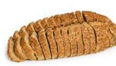
JOGGALIMPA SKIVAT 1 st x 500 g Artnr: 314