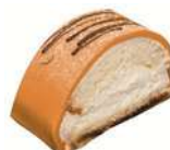
HALLOWEEN BAKELSE 2-pack Artnr: 2755