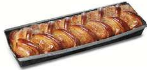
KARDEMUMMALÄNGD 1 st x 450 g Artnr: 483