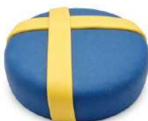
SVERIGE TÅRTA 8 bitar Artnr: 2960