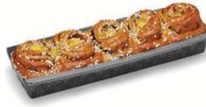
BUTTERLÄNGD 1 st x 450 g Artnr: 487