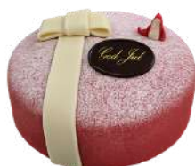
JULTÅRTA 8 bitar Artnr: 2923